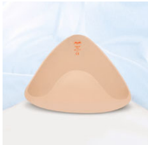
1052XV Valance Vario – Die symmetrische Prothese ist ca. 35% leichter