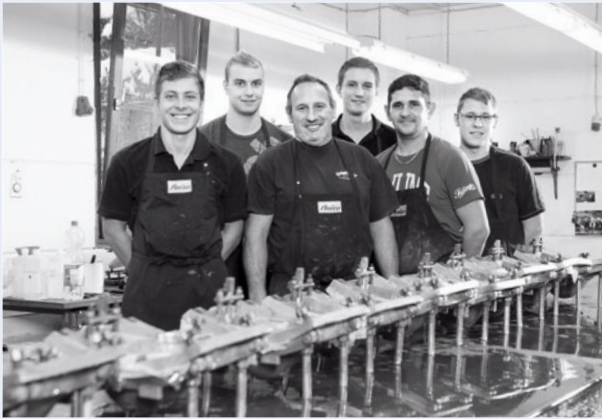
Technisches Entwicklungs-Team Orthopädie