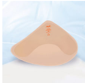
1083LV/RV Valance Vario Asymmetric – Die asymmetrische Prothese ist ca. 35% leichter