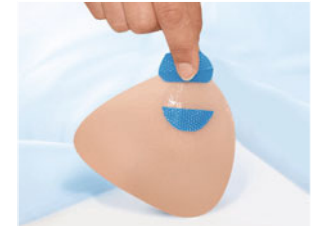
1046XV Sequitex Vario – Ausgleichsschale mit Haft- pads, alternativ auch ohne Haftpads im Spezial-BH von Anita tragbar