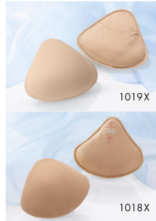
1019X TriFirst 1018X Equilight Für sanfte und leichte Erstversorgung und Homewear Individuell befüllbar mit medizinischem Vlies