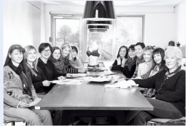
Entwicklungs-Team zuständig für unsere Büstenhalter-Kollektion