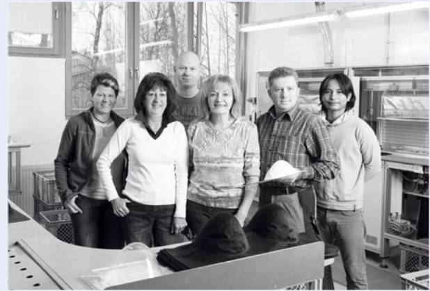
Technisches Entwicklungs-Team Textilverformung