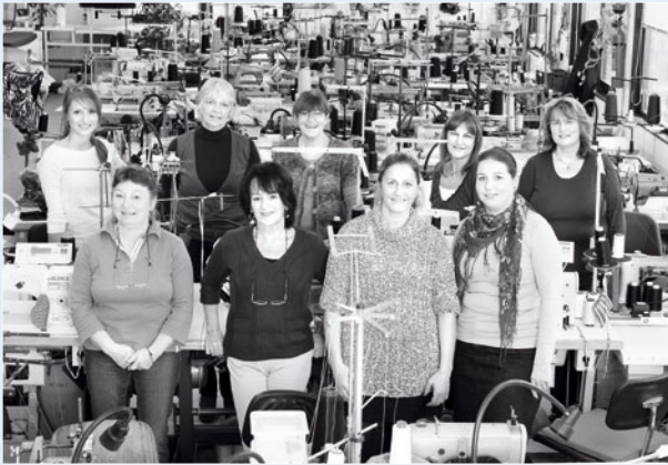
Entwicklungs-Team zuständig für unsere Badekollektionen